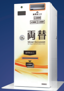
[ EX-310 + 卓上用台座 ]