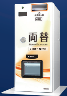
[ EX-101 + 卓上用台座 ]